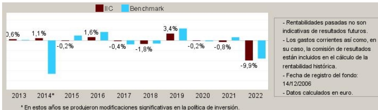
Gráfico rentabilidad histórica

Datos actualizados según el último informe anual disponible.