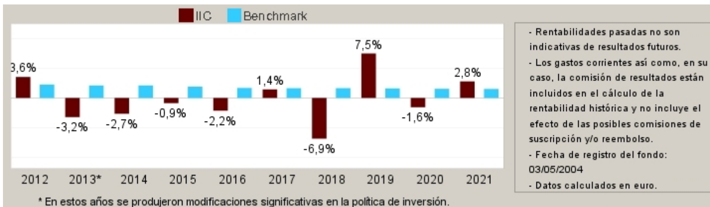
Gráfico rentabilidad histórica

Datos actualizados según el último informe anual disponible.