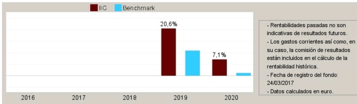
Gráfico rentabilidad histórica

Datos actualizados según el último informe anual disponible.